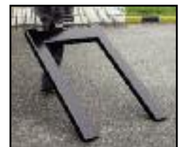
Griff und vorne montierte Rollen zum praktischen Anheben und Transportieren der Waage