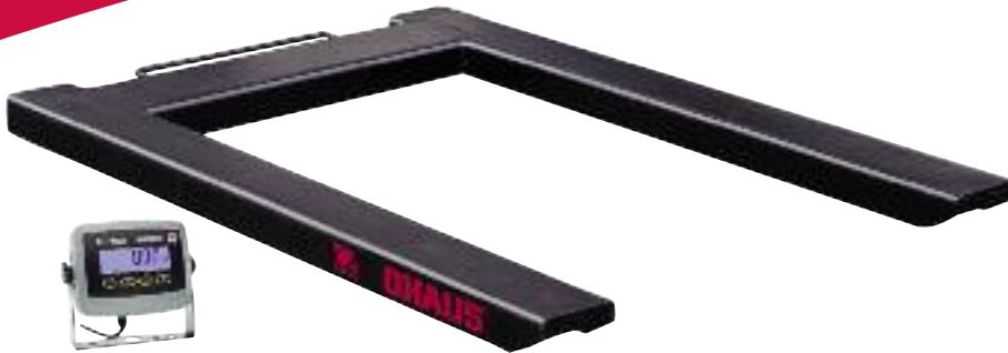
Modell aus lackiertem Stahl mit T31P Anzeigegerät abgebildet