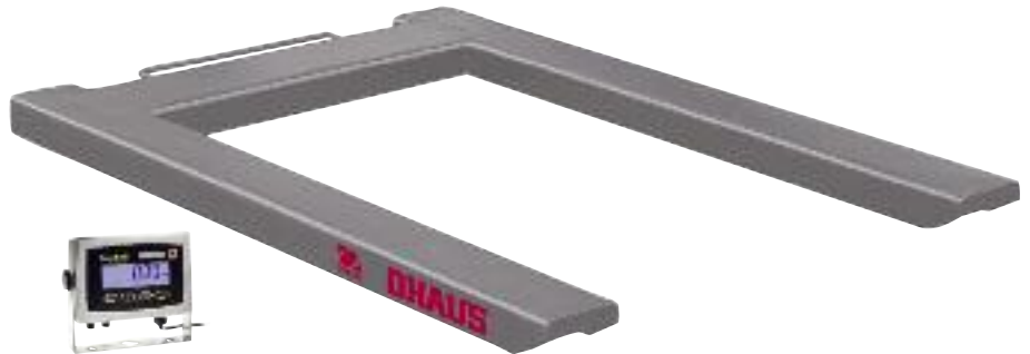
Edelstahlmodell mit T31XW Anzeigegerät abgebildet