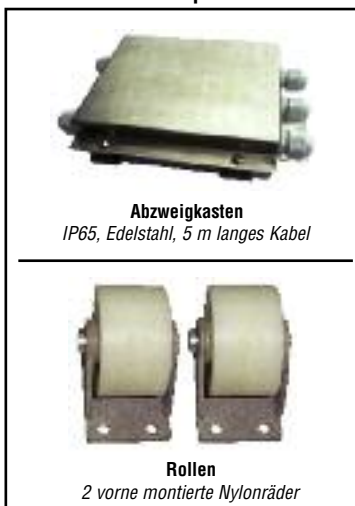
Abzweigkasten IP65, Edelstahl, 5 m langes Kabel